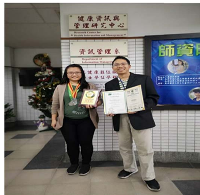
表 3-1-3 本系學生競賽傑出表現