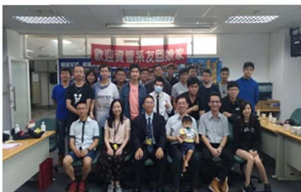
資管系系友回娘家